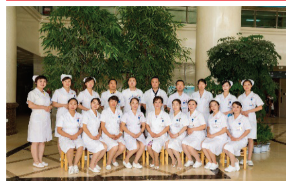
老年医学科被评为“酒泉市五一巾帼先进集体”