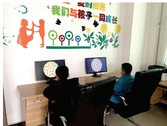
弱视患儿正在做视觉训练

的问题出现的越早，影响就越严重。弱视其实是一种常见的儿童发育性眼病，它的发病率在3%左右。在英文俚语里被叫做“懒惰的眼睛”（lazy eye），意思就是说，这只患病的眼睛很懒惰，不会主动去看东西。眼科医生对弱视的定义是：视觉发育期由于单眼斜视、未矫正屈光参差和高度屈光不正以及形觉剥夺引起的单眼或双眼最佳矫正视力对于相应年龄的视力，或双眼相差2行或以上，视力较低眼为弱视。弱视也是一种功能性疾病，通过在视觉发育关键期内的有效治疗，可以让视觉功能完全康复。 一旦发现弱视，需要及时治疗，而且最好在视觉发育旺盛的时期内治疗，超过这个阶段，效果就大打折扣了。弱视的治疗不能靠手术、靠吃药，关键是坚持佩戴合适的眼镜和坚持不懈的弱视综合治疗。 我院眼科2018年11月引进多宝视多媒体视觉功能训练治疗软件，是目前治疗弱视、提高视觉功能的最新方法，凝练了生物刺激、精细训练、视觉技巧训练、同视训练、双眼分视训练、融合功能训练、立体视训练等多种训练方法精华的综合治疗方法，它比传统治疗更具个性化、针对性