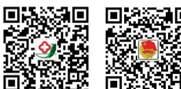
酒泉市人民医院 酒泉市人民医院团委

总 编：陆兴蓉 副总编：高发旺 王清贵 李振林 常志宏 责任编辑：刘秦勤 本报摄影：李玉龙 王 鹏