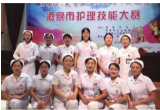
酒泉市护理技能大赛活动现场合影

在中华人民共和国成立70周年到来之际，为深入贯彻落实习近平总书记新时代中国特色社会主义思想，大力弘扬工匠精神，凝聚全市护理工作助力建设“健康酒泉”的智慧和力量，9月11日，由酒泉市总工会、酒泉市卫生健康工作委员会、酒泉市人力资源和社会保障局联合举办的“庆华诞·筑基础·展风采·促提高”酒泉市护理技能大赛在酒泉市人民医院落下帷幕。