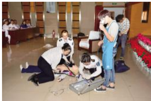
急救中心演示院前急救场景