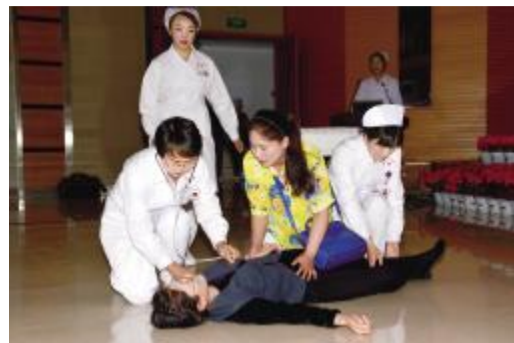
护理人员心肺复苏培训师演示院内突发心脏骤停的急救场景

大会的第二项内容是以“扬生命之帆,护生命之航”为主题的心肺复苏技术场景演示。分别由急救中心演示院前急救场景、医院护理人员心肺复苏培训师演示院内突发心脏骤停的急救场景、重症医学科演示重症监护病房急救场景。“伴随着急促的救护车声,凌乱的脚步声、病人痛苦的呻吟声以及家属焦急的催促声,出现的是一精神饱满、训练有素、技术精湛、团结一致的医护队伍。他们临危不乱,成竹在胸,用自己熟练的手法,快速、准确的对患者实施急救,将一幕幕实际工作中的急救场景真实再现,赢得了会场参会人员的一致好评。本次心肺复苏技术场景演示在展示我院医护人员心肺复苏技术培训成果的同时,也激励着更多的医护人员学技术、比技术,为患者更好