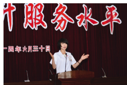
演讲比赛现场照片