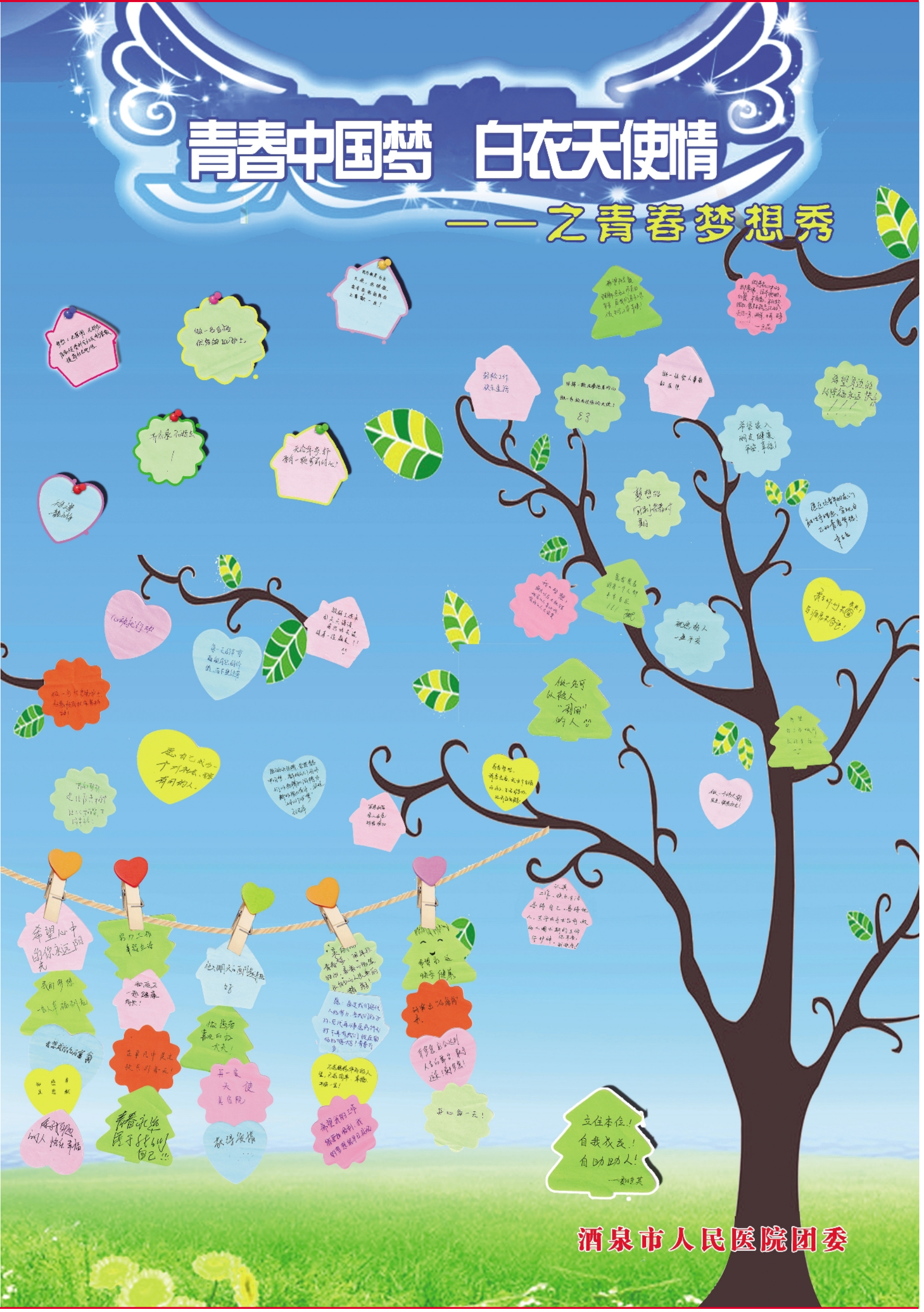
酒泉市人民医院团委